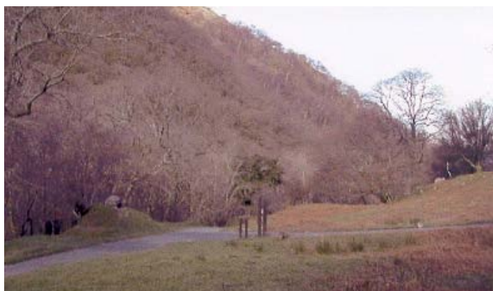
Tua 1915.....a 2001

"Breichiau", Aber, (saeth) yn ddigoed, tua 80 mlynedd yn ôl...pam?