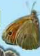
Gweirloyyn y glaw