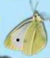
Gwyn gweithennau gwyrdion