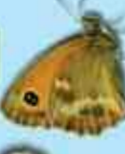
Gweirloyyn y ddol