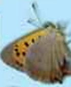
Gweirloyyn y perthi