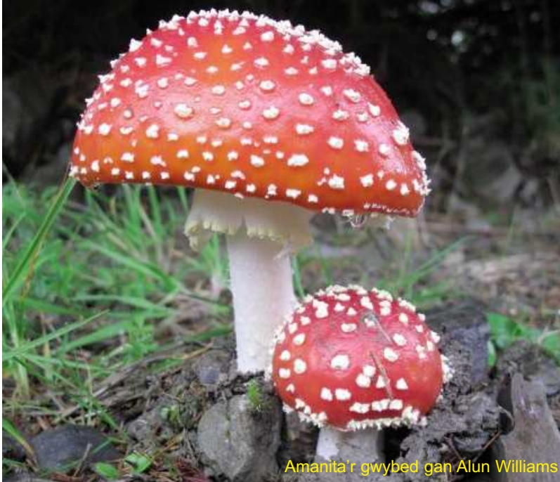
Amanita r gwybed

Mae yna Tyddyn Madarch ar Ynys Môn, enw sy'n dyddio'n ôl i ddechrau'r 17 eg . ganrif. Beth yw tarddiad y fath enw tybed?