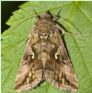
Gwyfyn y fforch arian