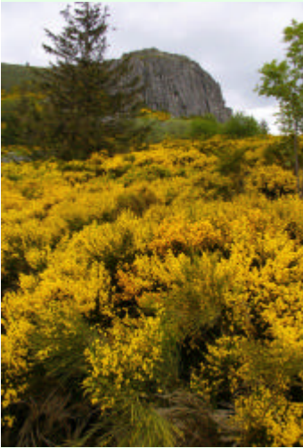
Rhostir o fanadl yn ne Ffrainc. Ychydig o eithin sydd yno.

Mae'n debyg bod y celliau gwreiddiol, fel rhai heddiw, yn cynnwys pob math o blanhigion, gan gynnwys y banadl. Mae briar a bramble yn dod o'r un gwraidd. Gyda threigl amser, dyma brom yn troi yn broom sef planhigyn y banadl yn unig. Hwn oedd y llwyn i wneud ysgubau i godi llwch cyn oes yr iwbanc a'r hwfyr.