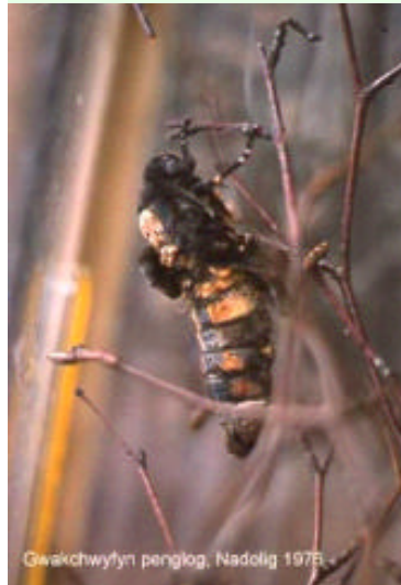
Gwackchwyfyn penglog, Nadolig 1975

cyfarwydd i ni heddiw ar ôl yr amryw gyfnodau hirfelyn tesog yr hafau diweddarach. Gwelais loynnod byw megis brithribinau porffor ( purple hairstreaks ) yn mentro o'u coedwigoedd derw arferol i anialdiroedd agored y