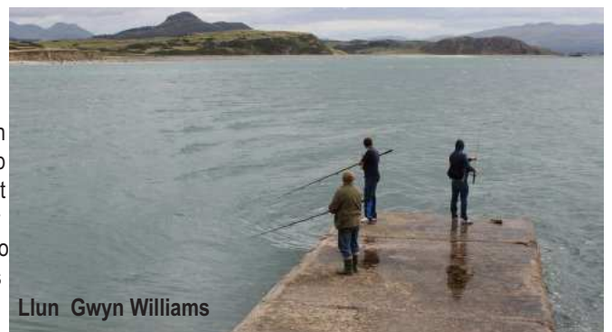
Llun Gwyn Williams

gydai cegau ar agor yn bwydo ar y plankton, a does dim diddordeb ganddynt mewn abwyd na llithiwr.