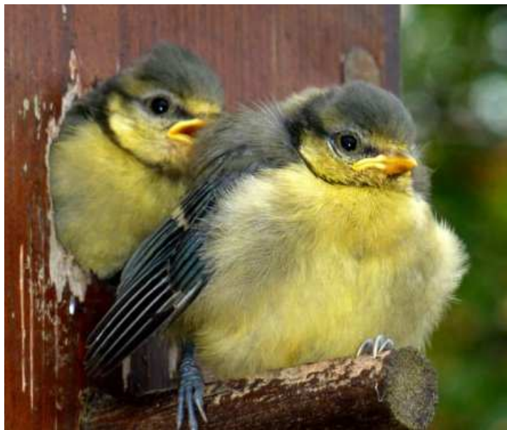
Titw Tomos Las yn brysur yn bwydo'r cywion, 4 ohonynt.