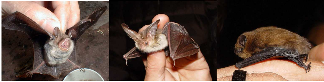
Ystlum Natterer, ystlum hirglust a ac ystlum bach

Rhain hefyd yw'r ystlumod mwyaf cyffredin yng nghefn gwlad ac ni ddylai eu cynrychiolaeth gymharol uchel yn y pellenni ein synnu o gwbl. Ond yn ôl pob son mae naw ystlum o bob deg yn y wlad yn Ystlum Lleiaf [erbyn hyn mae dau fath o ystlum lleiaf wedi ei ddisgrifio], a dylai ei gynrychiolaeth yntau fod yn uwch na'r ddau arall o'r herwydd. Gan nad felly yr oedd hi, efallai fod yr Hirglust, yr ystlum amlycaf ar y fwydlen drwyddi draw, dan fwy o fygythiad oddiwrth y dylluan oherwydd ei arfer o loffa am bryfetach mewn glaswellt a phorfa. Nid yw'n arfer gan y ddau arall wneud hynny, ac hwyrach eu bod fymryn yn ddiogelach o ganlyniad.