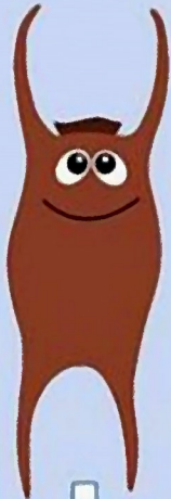
Raja undulata Morgath donnog