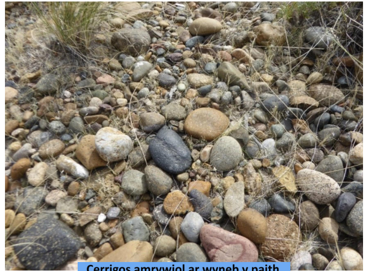
Cerrigos amrywiol ar wyneb y paith