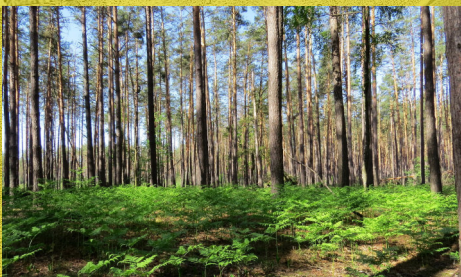
■ Coedwig bin ger Kyiv (Klavdievo) ■ Llund Аїмаїна хїкару (Comin Wicimedia)