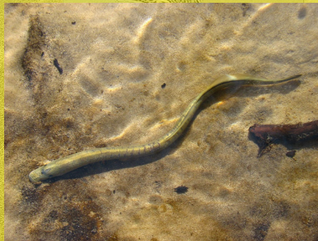
■ Llysywen bendoll y nant Iwcráin ■ Eudontomyzon mariae , Мїнога українська ■ Llund Geomyces .destructans