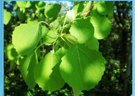
■ Aethnen, Populus tremula ■ Llund I, Hugo.org (Comin Wicimedia)