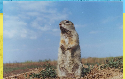
■ Gwiwer fraith y ddaear ■ Ardal Odessa ■ Llund V.A. Lobkov (Comin Wicimedia)