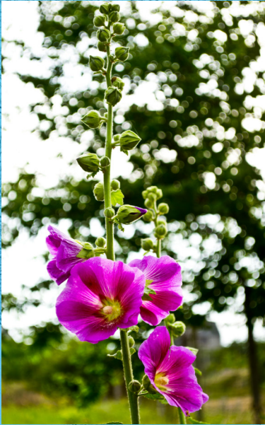
■ Hocysen wyllt ■ Tiliihul ■ Llund Matskov

Dyma ychydig o luniau i ddangos cefnogaeth i bobl Wcráin