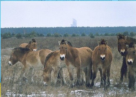
■ Ceffylau Przewalski ■ Ardal waharddedig Chernobyl ■ Llund Wikiwand