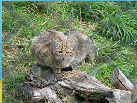
■ Cath wyllt ( Felis silvestris ) ■ Llund Martin Steiger (Comin Wicimedia)