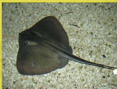
■ Morgath ddu, Dasyatis pastinaca ■ Морський кіт ■ Llund Glen Bowman