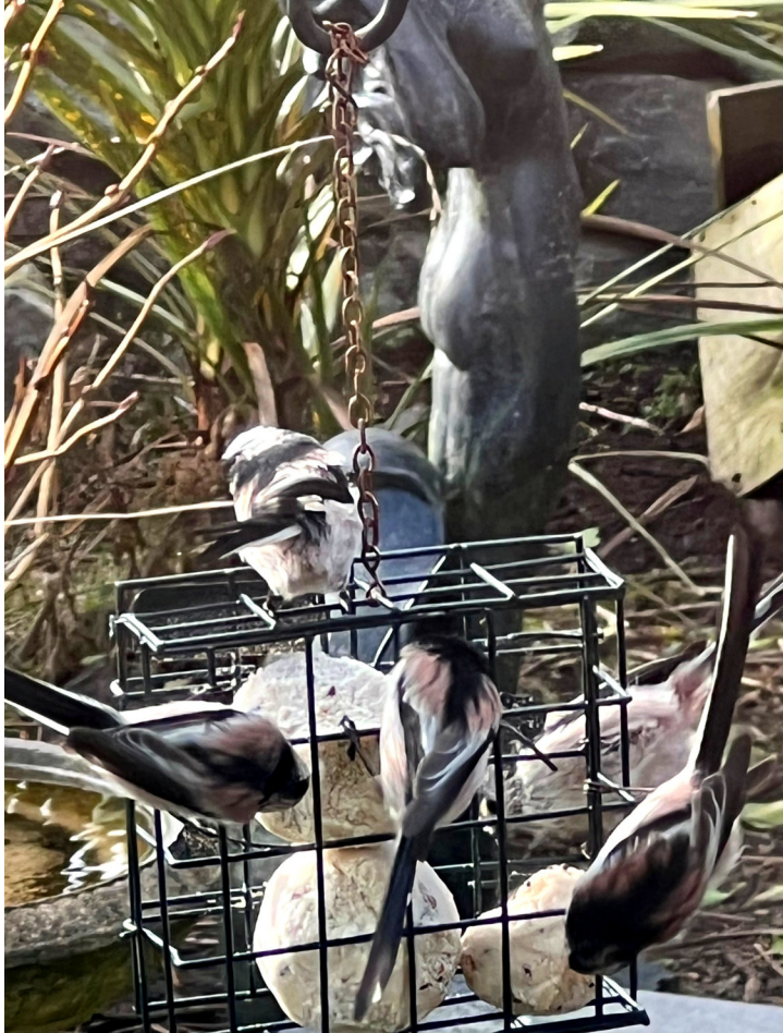
■ Titw cynffon hir ym Mhentraeth ■ Traeth Coch 2 Mawrth 2022 ■ Owain Thomas

Ar yr un pryd mae gaeafau yn fwynach ac yn llai heriol i adar o ddydd i ddydd beth bynnag am yr effaith tymor hir. Teg gofyn felly, a oes wir angen i'r adar wir cael eu bwydo? Cofiw'n ein bod yn byw bellach yng nghyfnod mawr yr Anthroposen – sef y cyfnod rydyn ni bobl yn cael effaith gynyddol ar yr amgylchedd.