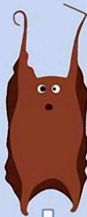
Raja microocellata Morgath lygad bach