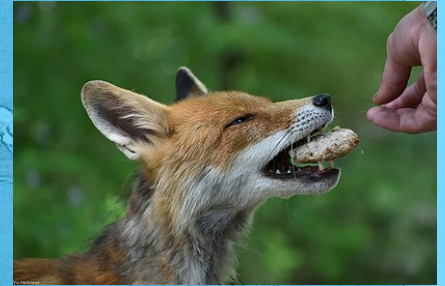
■ Llwynog ■ Ardal waharddedig Chernobyl ■ Llund Wikiwand