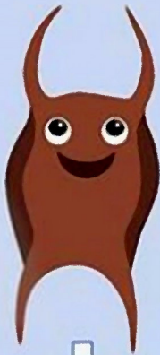
Raja clavata Morgath arw