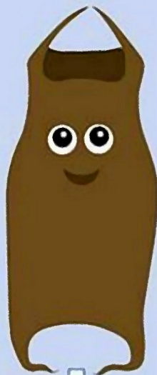
Dipturus batis Morgath las