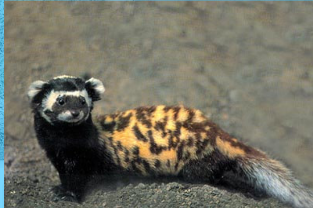
■ "peregusna" ( перегузня ) ■ ffwlbart brith ■ Llund Laszlo Szabo-Szeley (Comin Wicimedia)