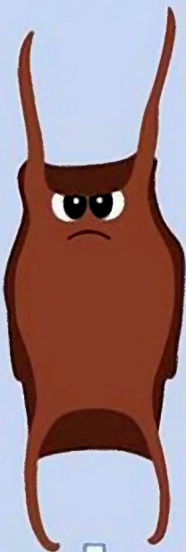
Raja brachyura Morgath felen