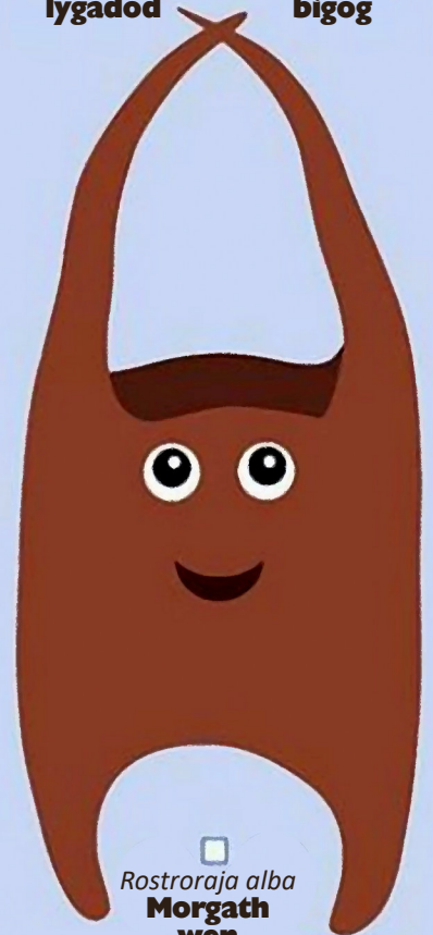
Rostroraja alba Morgath wen