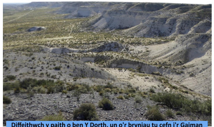
Diffeithwch y paith o ben Y Dorth, un o'r bryniau tu cefn i'r Gaiman