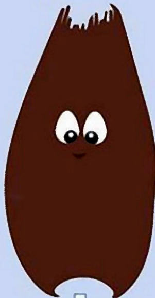
Dipturus intermedia Morgath drwynfain