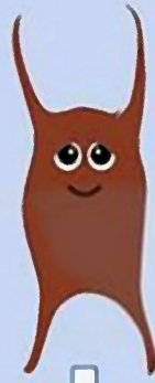
Raja montagui Morgath fannog