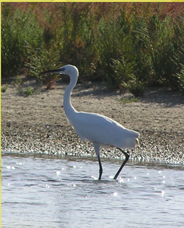
■ Crëyr bach ■ Traethellau Belosarayskoy (Môr Azov)